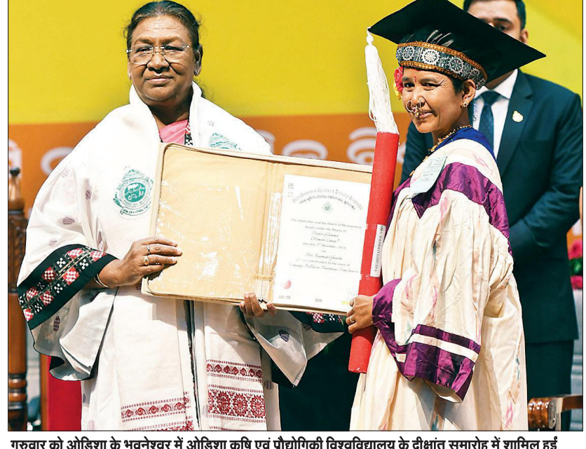
गुरुवार को ओडिशा के भुवनेश्वर में ओडिशा कृषि एवं प्रौद्योगिकी विश्वविद्यालय के दीक्षांत समारोह में शामिल हुईं भारत की राष्ट्रपति द्रौपदी मुर्मू।

कूड़ा-कचरा फैलाने या जानवरों का वध करने को अपराध माना गया है। इन अपराधों के लिए तीन साल तक की कैद, एक करोड़ रुपये तक का जुर्माना या दोनों हो सकते हैं। भारतीय जनता पार्टी के वृजलाल ने कहा कि मोदी सरकार अंग्रेजों के जमाने का कानून को रद्द कर रही है या उसके स्थान पर नया कानून बना रही है। इसी क्रम में 1934 के पुराने विमानन कानून के स्थान पर अब भारतीय वायुयान विधेयक 2024 लाया गया है जो इस क्षेत्र की वर्तमान जरूरतों को ध्यान में रखते हुये तैयार किया गया है। उन्होंने कहा कि जब देश को आत्मनिर्भर बनाया जा रहा है तो विमानन क्षेत्र को भी विकसित भारत के अनुरूप विकसित करने की जरूरत है। इसलिए यह विधेयक लाया गया है।