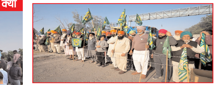
नूना न्यूज़ एजेंसी।

बॉर्डर पर किसानों को रोकने के लिए 7 लेयर की बैरिकेडिंग की गई थी। किसानों के कूच को देखते हुए अंबाला में इंटरनेट सर्विस को बंद कर दिया गया है। साथ ही स्कूल और कॉलेज में भी छुट्टी का ऐलान किया गया है। अंबाला जिला प्रशासन ने भारतीय नागरिक सुरक्षा संहिता (बीएनएसएस) की धारा 163 के तहत एक आदेश जारी किया है, जिसमें जिले में 5 या अधिक लोगों की किसी भी गैरकानूनी सभा पर रोक है। जारी आदेश के मुताबिक अगले आदेश तक पैदल, वाहन या अन्य