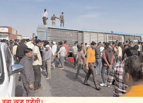
नूना न्यूज़ एजेंसी।

6 की मौत, यात्रियों ने बताया आखिर हुआ क्या