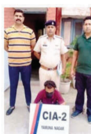
पकड़ा गया आरोपी पुलिस टीम के साथ।