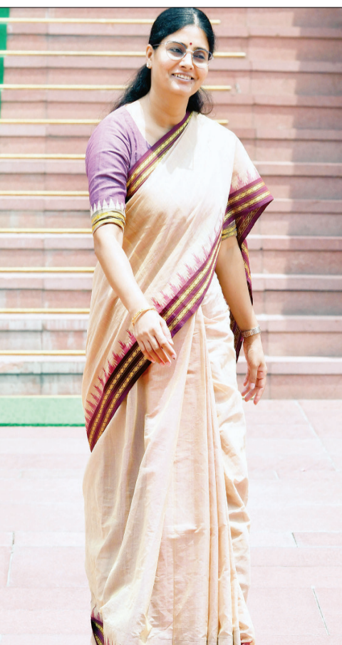
मंगलवार को नई दिल्ली में संसद भवन में केंद्रीय मंत्री अनुप्रिया पटेल।

नई दिल्ली: सरकार ने कहा है कि देश को हर क्षेत्र में आत्मनिर्भर बनाया जा रहा है और जिन उपकरणों का पहले विदेश से आयात होता था, उनका घरेलू स्तर पर ही निर्माण हो रहा है तथा जरूरत पूरा होने के बाद उनका निर्यात भी किया जा रहा है (लोकसभा में वाणिज्य एवं उद्योग राज्य मंत्री जितिन प्रसाद ने मंगलवार को एक सवाल के जवाब में कहा कि योजना थी कि बड़ी कंपनी आरंगी तो छोटे उद्योग भी विकसित होते रहेंगे। छोटे उद्योगों को बढ़ाने की योजना को और महत्वपूर्ण बनाया जा रहा है और बड़ी संख्या में इसमें तेजी से निवेश आ रहा है। कई राज्यों में इसके लेकर अच्छा काम मिल रहा है और मेक इन इंडिया के तहत विनिर्माण क्षेत्र में तेजी से काम हो रहा है। पहले जो उपकरण विदेश से आते थे, वे अब देश में बन रहे हैं।