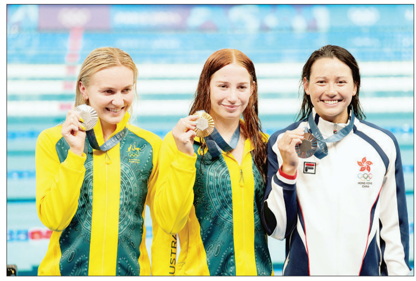
फ्रांस के पेरिस में ओलंपिक खेलों में महिलाओं की 200 मीटर फ्रीस्टाइल तैराकी के पदक समारोह के दौरान पदक विजेता ऑस्ट्रेलिया की मोली ओकेलाघन, रजत पदक विजेता ऑस्ट्रेलिया की एरियन टिटमस और कांस्य पदक विजेता चीन के हांगकांग की सिओभान बनाडेट हाउये।