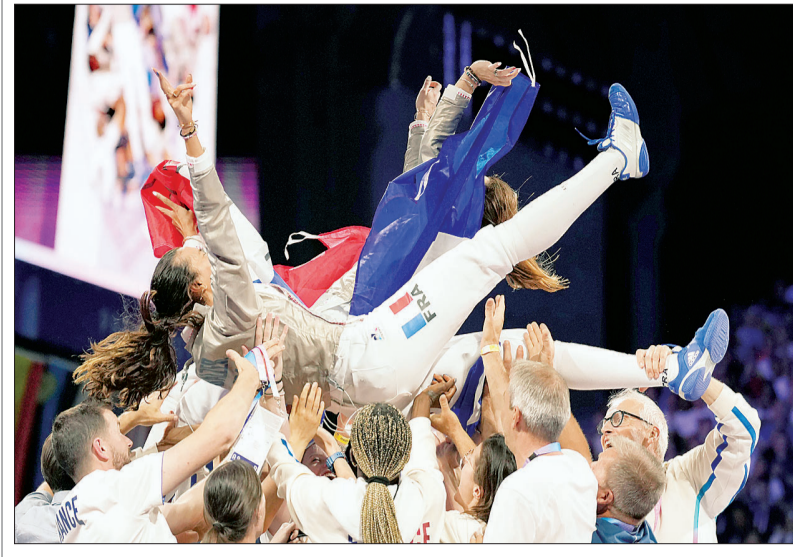
फ्रांस में पेरिस ओलंपिक खेलों में महिलाओं की सेबर व्यक्तिगत स्वर्ण पदक मुकाबले को जीतने के बाद जश्न मनाती फ्रांस की टीम।