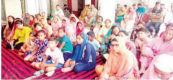
कार्यक्रम में उपस्थित भक्तजन।