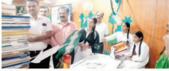
प्रदर्शनी का अवलोकन करते मुख्यअतिथि एवं प्रधानाचार्य।

मुरलीधर स्कूल में हुआ इको फ्रेंडली सस्टेनेबल इंडिया प्रदर्शनी का आयोजन