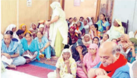
अंबाला शहर के काजीवाड़ा स्थित महावीर सत्संग सभा में आयोजित राशन वितरण कार्यक्रम में उपस्थित लोग।