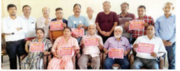
बैठक के दौरान राष्ट्रीय परशुराम सेना ब्रह्मवाहिनी के पदाधिकारी।

विशाल ब्राह्मण महाकुंभ को सफल बनाने के लिए ब्रह्मवाहिनी नेकी बैठक